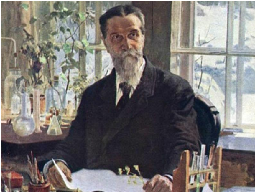
К. М. Максимов. Ботаник-физиолог К. А. Тимирязев (1953)