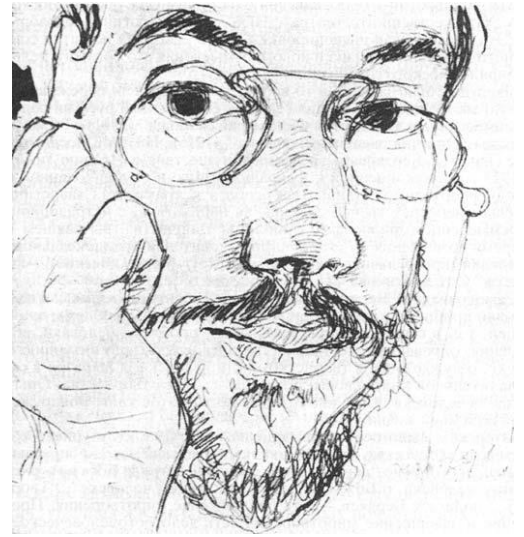
Александр Бенуа. Автопортрет. 1893 г.

Thanks to family connections with the world of art in the early childhood Alexander was sent for education to the educational institution established by a charitable organization “The Imperial Human-Loving Society” and later continued his education in the private school of Karl Ivanovich May. In the end of 1880ths Alexander Benois began to attend classes in the Academy of Arts in Saint Petersburg as a non-credit student. Beyond arts Alexander entered the faculty of law of the Saint Petersburg Imperial University.