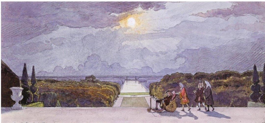
Александр Бенуа. Прогулка короля. 1897 г.

Alexander Nikolayevich Benois died on 9 February 1960 in Paris not reaching his 90th birthday anniversary only several months.